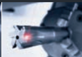
ULTRASONIC / LASERTEC